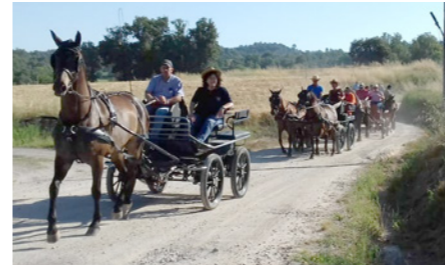
Una bona caravana. Juny 2018.

A finals de juny, i durant 8 dies, un grup de francesos han passejat pel Lluçanès, convidats pels «Amics del Carruatge» d'Olost. Aquests francesos havien portat a terme una bona aventura: Fer, per trams, la travessa amb carruatge des de La